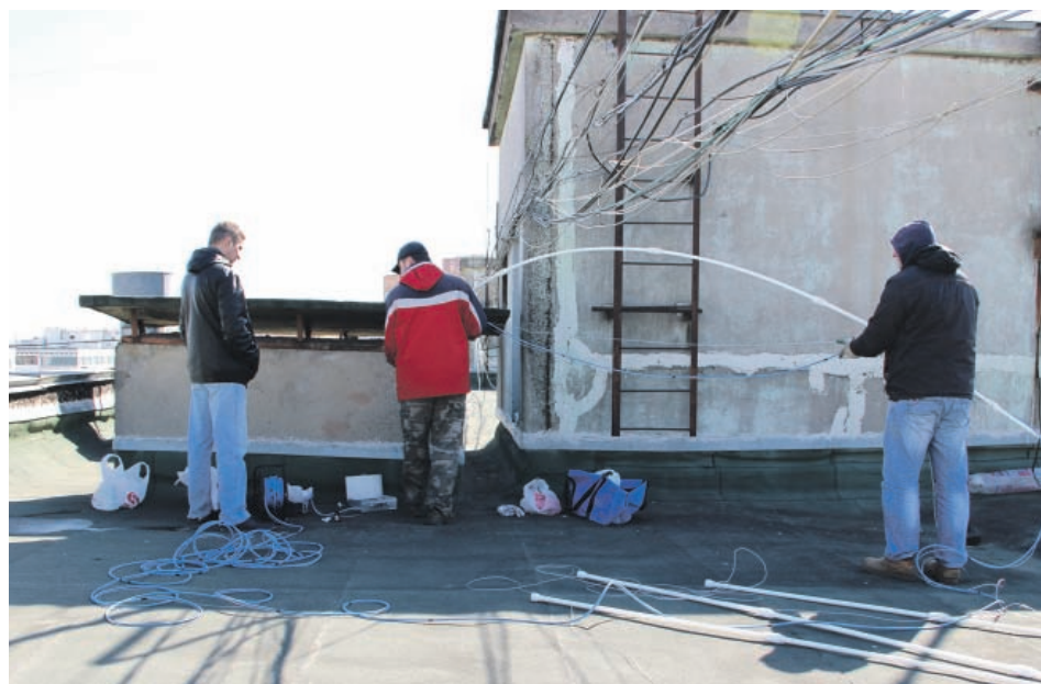
При помощи специального оборудования элемент, ограничивающий водоотведение, спускают в общедомовой канализационный стояк