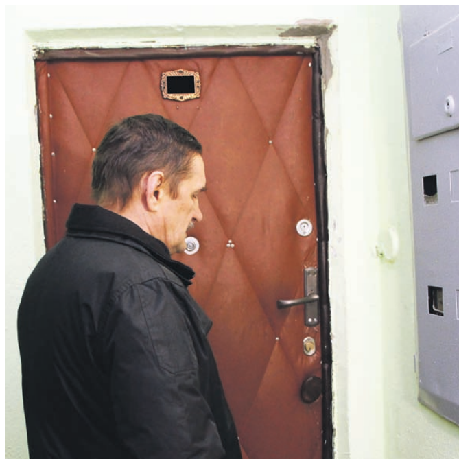
В день отключения коммунальщики еще раз пытаются напомнить гражданину о его долге

ющие инстанции. По данным МУП «Расчетный центр» 2400 должников не платят за жилищно-коммунальные услуги более года, что составляет 3% от всех личных счетов, зарегистрированных в этой организации. Совсем нерадужной ситуацией выглядит, если сюда добавить еще тех должников, которые не вышли за рамки года. Последствия просчитать несложно – некоторые горожане отказываются платить управляющей компании за жилищно-коммунальные услуги, та в свою очередь не может оплатить счета, выставленные компаниями, предоставляющими тепло, воду и электричество. В конечном итоге предприятия ограничат предоставление услуг, либо применят другие санкции. Вряд ли кого-то устраивает такое развитие ситуации, но оно вполне реально. Именно поэтому принято решение применить к не-